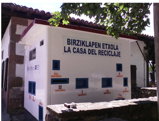
Baztango birziklapen etxola

Etxetxo hauek etxola zaharberituak dira, berrerabiliak eta, erran bezala, finkoak izanen dira, kokatu diren lekuan egonen baitira jendeak erabil ditzala. Oraingoz Baztanen eta Bortzirietan jarri badira ere, urtea akitu baino lehen Malerrekako ere berea izanen dutela aurreikusten da.