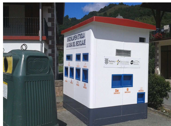
Bortzirietako birziklapen etxola

Baztango etxola Elizondon jarri da, Jaime Urrutia karrikaren hasieran, Merkatuko Plazan, esne makinaren eta arropa edukiontziaeren ondoan; Bortzirietakoa berriz, Etxalarren, herri sarrerako aparkalekuan. Beraz, bi herri horietan orain arteko kamioi bidezko zerbitzu mugikorra desagertuko da.